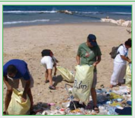
מבצע ניקיון בחוף הים