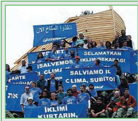
פעילות בין-לאומית בנושא שינויי האקלים