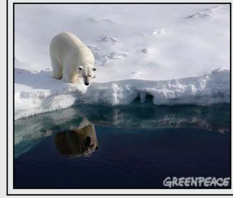
הפשרת קרחונים באזורי הקוטב