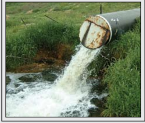
זיהום נחל במי ביוב